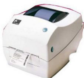
Imprimante badges jetables