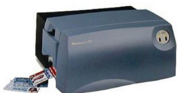
Imprimante badges plastiques

Carte Papier Bristol 85 x 54 mm lot de 1000 ref : 115A