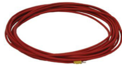
Boucle au Sol