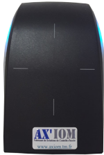
Lecteur de badges