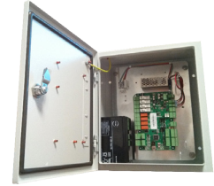
UTL 418 COI