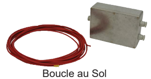
Boucle au Sol