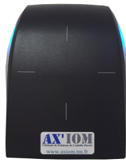
Lecteur de badges