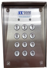
Clavier à codes