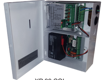
XP 99 COI